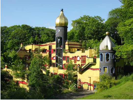
Ronald McDonald Huis te Essen (2005) Een tehuis voor zeer zieke kinderen waar de familieleden kunnen logeren.

Een architect die een voorliefde had om voor kinderen te werken was 'Hundertwasser' omdat hij een kindervriend was en zijn fantasie hier het best kon uitleven.