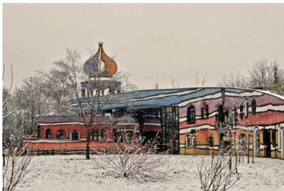
Kindervallei te Valkenburg revalidatiecentrum (2007)

Kinderdagopvang voor 100 kindreen op een verlaten fabrieksterrein, ingewerkt in de hellingen van het terrein. Het dak is gedeeltelijk bebost en is ook een speeltuin.