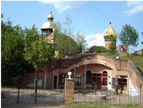
Kinderdagopvang te Heddernheim (1995)

Kinderdagopvang voor 100 kindreen op een verlaten fabrieksterrein, ingewerkt in de hellingen van het terrein. Het dak is gedeeltelijk bebost en is ook een speeltuin.