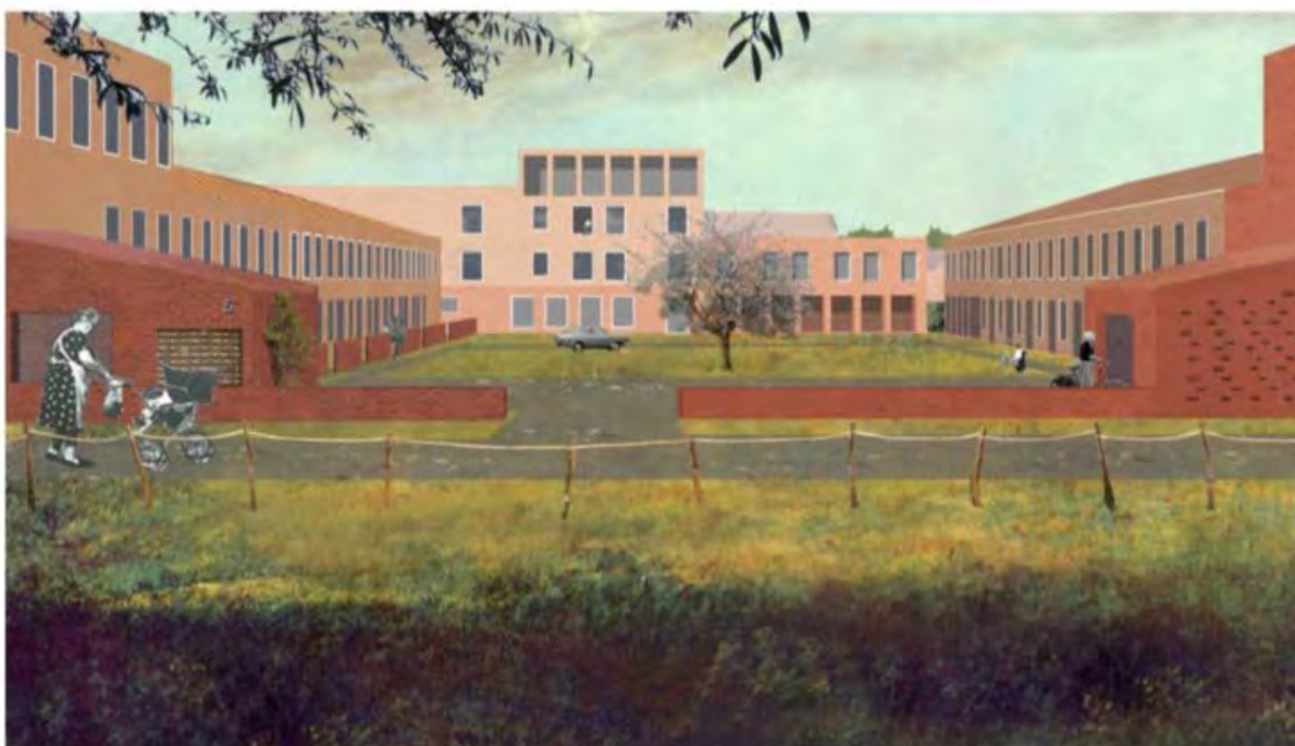
Een hedendaags alternatief voor de klassieke verkaveling: Middenheide in Beveren.

Een antwoord op deze vragen kan je vinden aan de hand van een recent voorbeeld dat de bouwmeester intens begeleid heeft, het zijn een aantal proefprojecten met geconcentreerde bebouwing die een antwoord moeten geven op de open, verspreide en ruimteverspillende bebouwing in Vlaanderen.