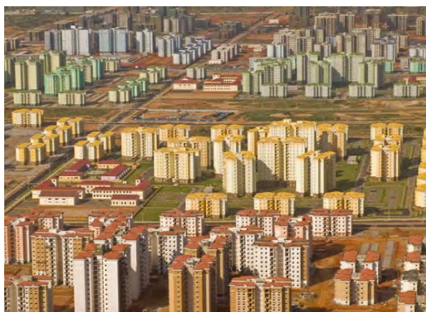
Spooksteden in China