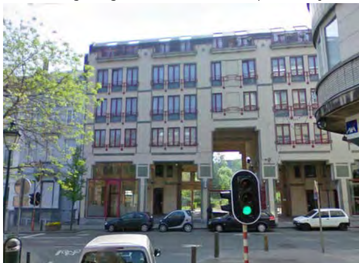
foto: metro ingang te St. Gillis Brussel