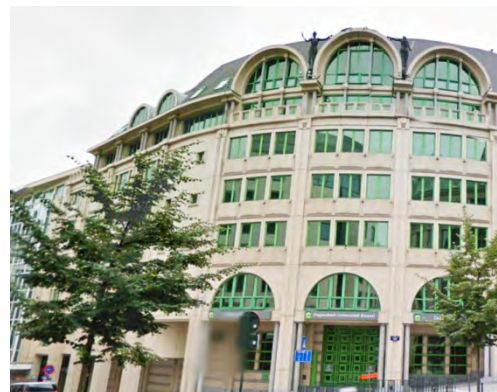
Foto: de Odisee Hogeschool te Brussel centrum van architect prof. A. Hoppenbouwers is een goed voorbeeld van architectuur die de stad goed aanvoelt, zonder te vervallen in copy/paste.

Dit getuigd vooral van respect voor het patrimonium en de bewoners/gebruikers in hun diversiteit.